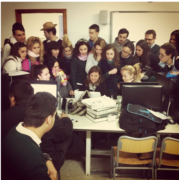
Imagen: Proyecto FGL . Elaboración propia

Aprender a través de proyectos en Educación Secundaria y Bachillerato no sólo representa una opción eficaz para la adquisición de conocimientos sino también para la socialización del alumnado, para la integración del currículum y para la atención a la diversidad en contextos complejos. Veamos algunos ejemplos de proyectos. En esta sección puedes conocer algunas prácticas de referencia en Educación Secundaria. ¿Empezamos?