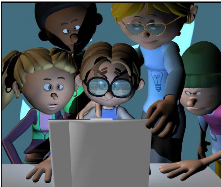
Imagen de Cede_ite. Licencia CC BY-SA 2.0

¿Son todos los alumnos iguales? Si os hicieran esta pregunta seguramente vuestra respuesta sería que no. En este apartado vamos a estudiar los tipos de alumnos que nos encontramos en e-Learning. Para tal clasificación tomaremos como referente el tipo de participación que tienen en los foros de discusión dentro de un curso de e-Learning.