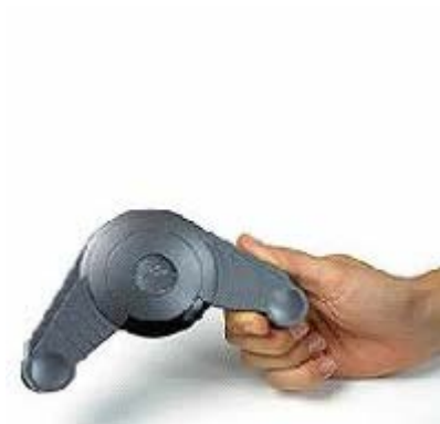
Pizarras de infrarrojos - ultrasonido