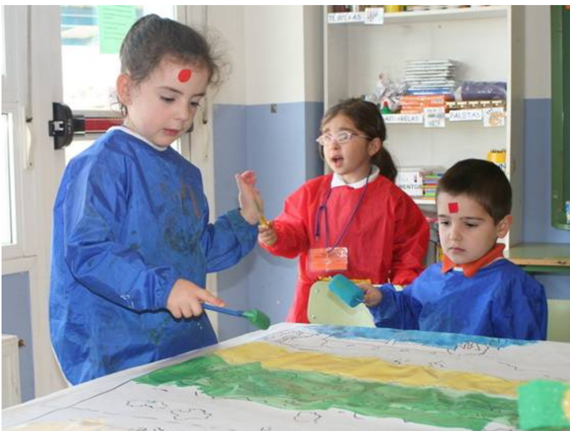
Niños de educación infantil pintando dentro del proyecto “Conociendo a Van Gogh” basado en la pedagogía constructivista.