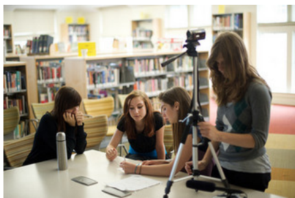
WIS 3353

Esta experiencia llevada cabo en 2011 volvió a plantearse, con notables mejoras, en el curso 2012 .