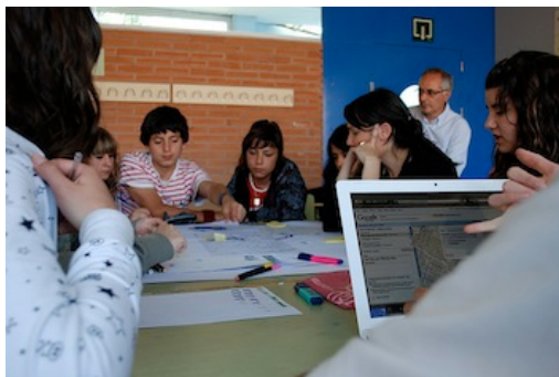
Mapeado del Itinerario 1 (Zonas Verdes) por LaFundició (CC BY-NC-SA)

Finalmente, si los Entornos Personales de Aprendizaje nacen ligados al aprendizaje informal, ¿seremos capaces de abrir nuestras metodologías didácticas para que esos PLE quepan también en los aprendizajes formales y no formales?