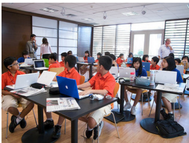
dream classroom