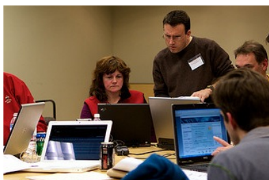
WordPress workshop

Un resumen de los resultados están pendientes de publicación con parte del próximo libro del Laboratorio de Medios Interactivos de la Universidad de Barcelona en su colección transmedia XXI , bajo el tema genérico ' Aprendizaje crítico, aprendizaje invisible y aprendizaje autorregulado '.