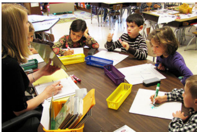
First grade reading , por woodleywonderworks (CC BY)

En mi trabajo (...) los PLE juegan un gran papel. De hecho gran parte de mi alumnado, sin saberlo, van introduciendo en sus blogs personales aquellas herramientas que van utilizando y descubriendo. Es un hecho que en el aula de hoy el aprendizaje informal va ganando cada vez más superficie y eso se refleja en sus producciones. Cuando el curso esté terminando les propondré que se construyan su PLE para que a la hora de abandonar el centro y llegar a otro no se les olvide, que no creo, los espacios que más usan y que más necesitan para desarrollarse en este mundo tecnológico.