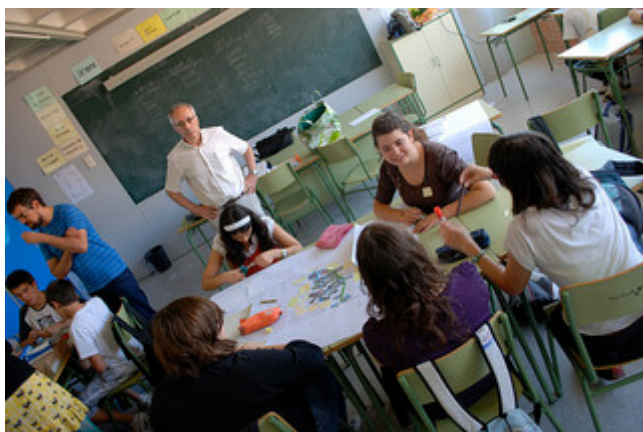
Mapeando itinerarios , por LaFundició (CC BY-NC-SA)