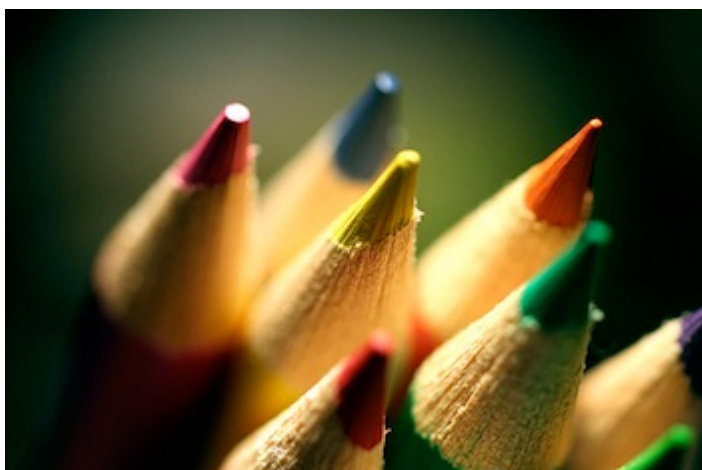
Glowing Colors

Queda ahora el trabajo, tanto para el currículo de primaria como el de secundaria, de analizar con detalle desde cada una de las áreas o materias cómo se contribuye a la adquisición de las competencias básicas, y en particular la competencia digital y la competencia aprender a aprender, para lo cual el modelo de diseño de Tareas Integradas para el desarrollo de las Competencias Básicas que propone iCOBAE puede brindarnos una valiosa ayuda.