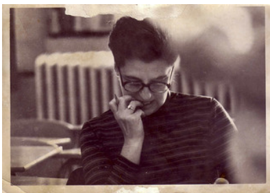
The Teacher , por Kevin Dooley (CC BY)

Una buena reflexión te puede ayudar a darte cuenta de qué tienes al alcance de tus manos, qué estas utilizando, qué puedes utilizar, qué es lo que haces en tu día a día y qué es lo que puedes hacer. Esta reflexión ha sido el punto de partida para aprender y conocer más, y así tal y como intencional el curso, ir construyendo nuestro PLE. Este entorno personal de aprendizaje, red de conocimientos, de herramientas e intercambio de materiales, informaciones, ideales, sugerencias, recursos... Y puedo decir que en mi caso esta construcción ha sido casi desde cero, pues sin contar con el blog, me he estrenado en Twitter, Facebook..., y aquí sigo peleándome con Diigo, todo sea por seguir construyendo mi PLE, seguir enriqueciéndome, y enriquecer así mi trabajo, a la escuela y a mis niños/as de infantil.