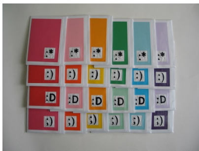
Imagen tomada por Ángela. Licencia CC BY-NC-ND 2.0

Podemos decir que todos los agentes que intervienen en un curso conforman una comunidad virtual , es decir, un grupo de personas que se encuentran unidas por un interés común y que se comunican por medio de las herramientas de comunicación que les proporciona la plataforma.