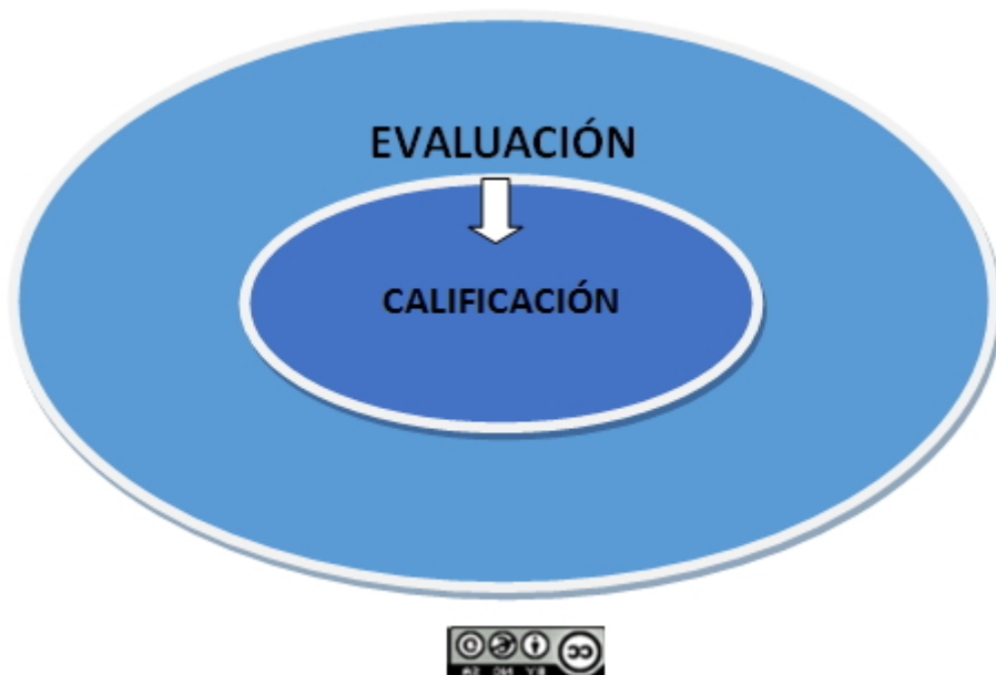
Imagen 2. La calificación como parte de la Evaluación

El propósito de la evaluación, por tanto, supera el binomio éxito/fracaso porque, por muy rigurosa que sea, no garantiza el éxito educativo del alumnado. Los resultados de la evaluación han de guiar los procesos de mejora mediante la orientación y ajuste de los procesos de aprendizaje, entendiendo siempre la evaluación como un proceso más global dentro del cual se incluye la calificación.