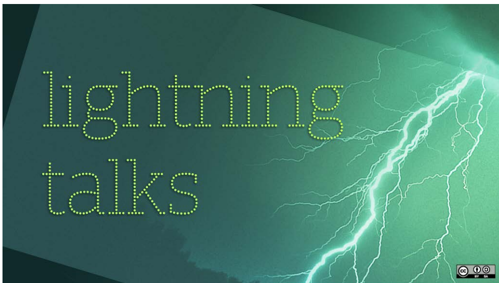
Imagen: Lightning Talks

De una manera consciente o no, regulada o sin regular, dirigida a lograr unos objetivos o de una manera más espontánea, la realidad es que hoy en día las redes sociales han entrado en todos los centros educativos. Y lo ha hecho en muchas ocasiones de la mano de los propios estudiantes que están interaccionando en redes sociales (a edades como hemos visto cada vez más tempranas). Lo han hecho también porque en muchos centros educativos son los propios profesores los que las han incorporado en su día a día para mantenerse actualizados y conectados con otros compañeros o para trabajar con sus alumnos. Y lo han hecho también porque son los padres desde fuera los que incorporan al centro educativo en sus usos habituales de redes sociales.