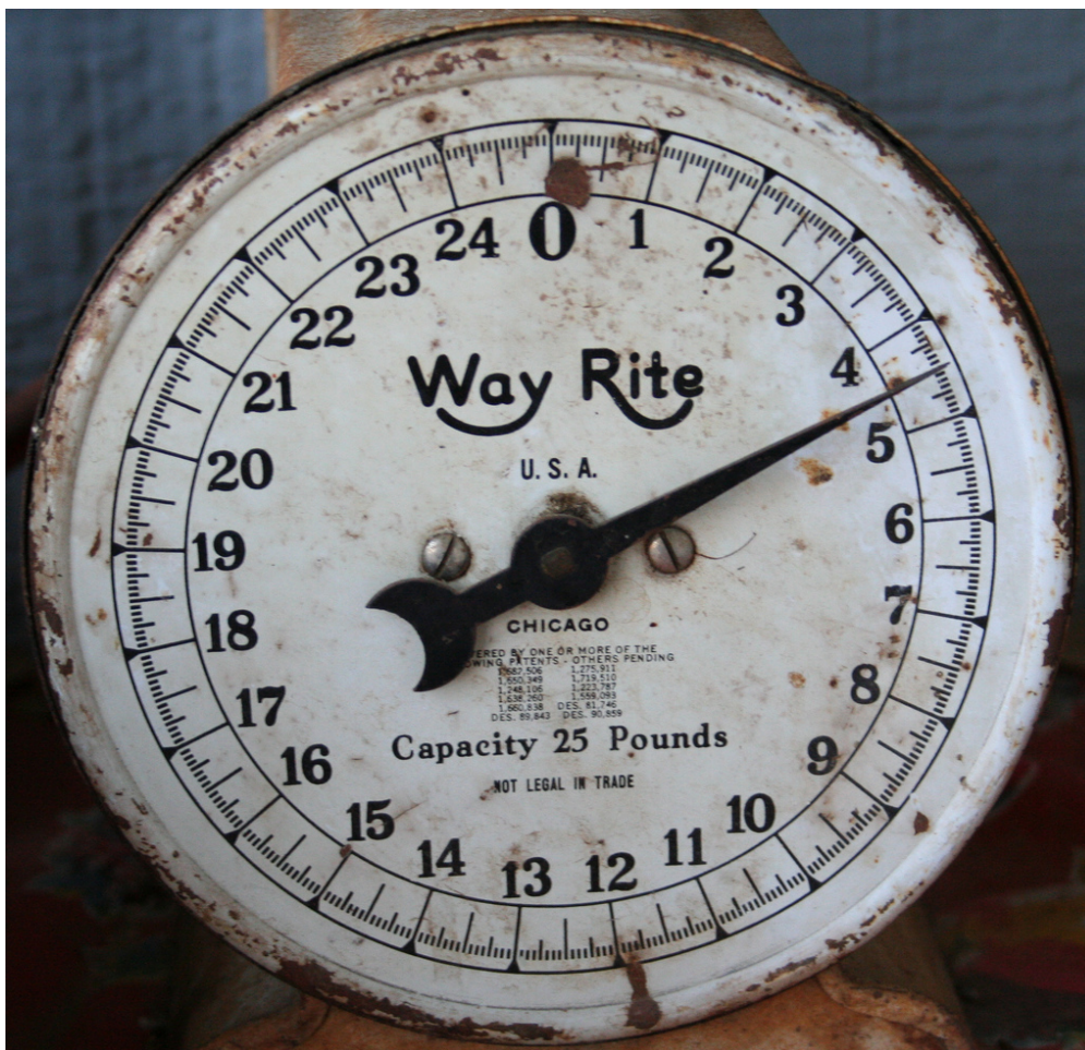
Imagen: Scale Faces