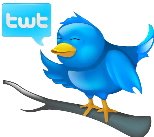
Imagen de Aha-Soft at Iconfinder . Libre para uso comercial.