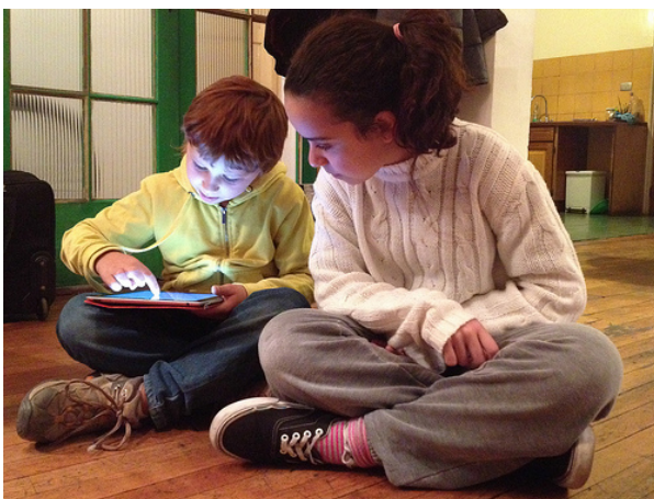
Imagen de Paulo Slachevsky , 2013, CC BY-NC-SA 2.0

Y revisaremos además diversas propuestas de promoción de la lectura a la luz también de este momento de cambio en el que se abren nuevas puertas para la comunicación.