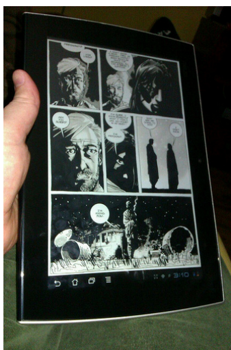
Imagen de Jorge Sanz , 2012, CC BY-SA 2.0