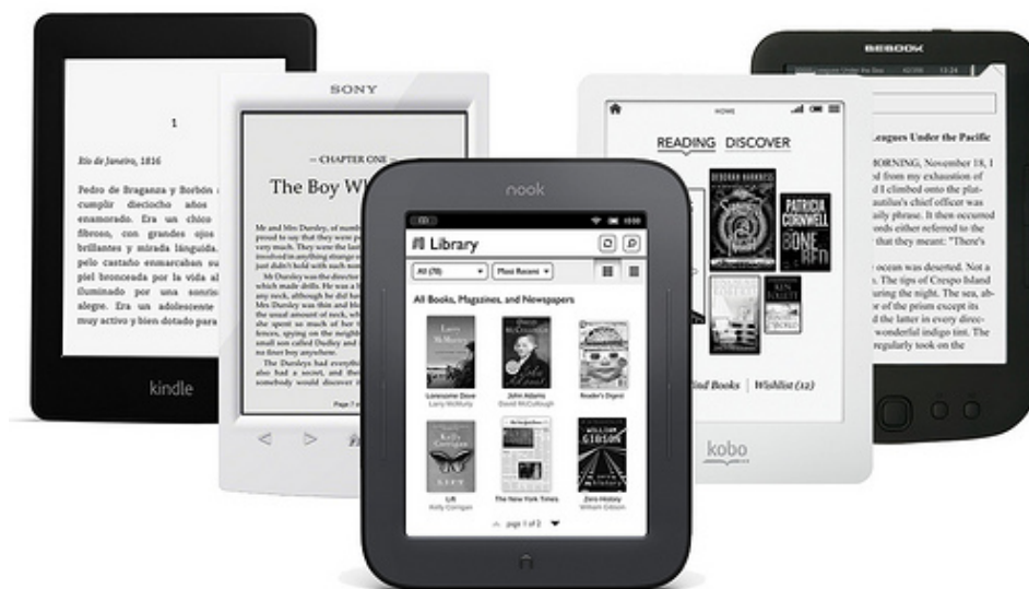
Imagen de María Elena , 2013, CC BY 2.0