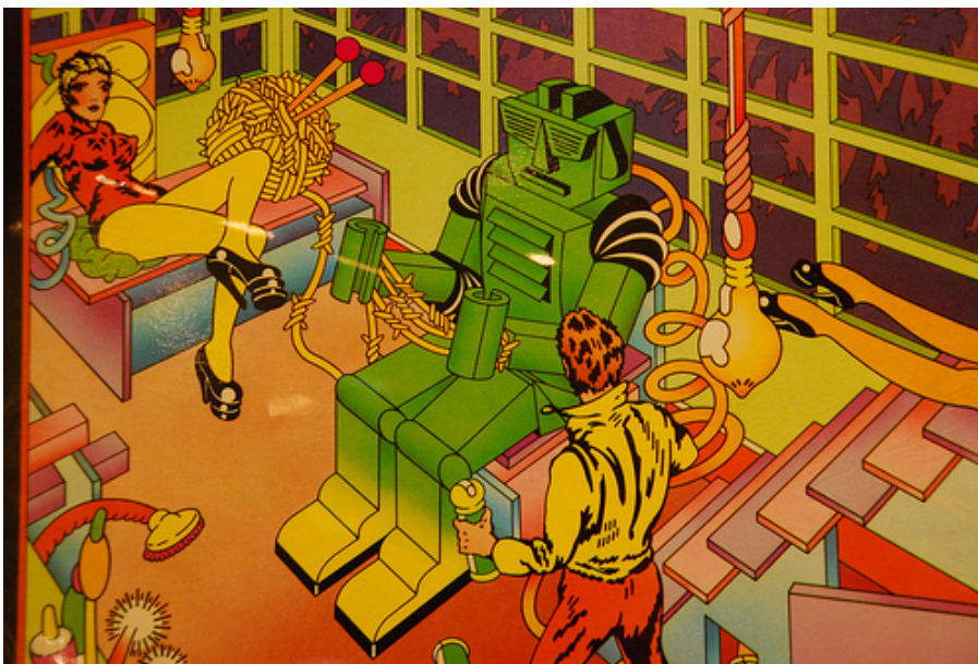
Imagen de Ricardo Hurtubia , 2010, CC BY-NC 2.0