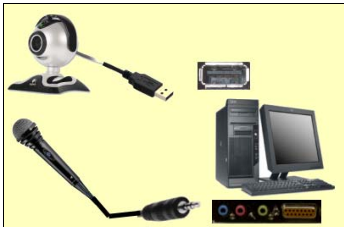
Conexiones Cámara-USB y Micrófono-Tarjeta Audio